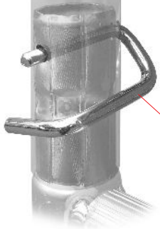
Zawieszka [ 704405 ]