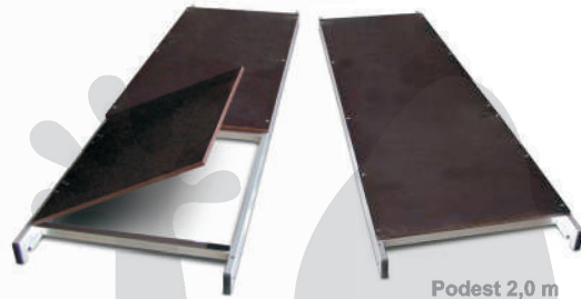
Podest z klapą 2,0 m [ 911001 ]