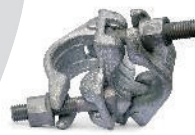
Złącze krzyżowe [ 708007 ]