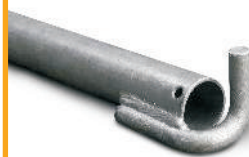
Kotwa rusztowaniowa 1,20 m [ 706256 ] 1,50 m [ 706263 ]