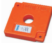
Cieżyarek balastowy 10 kg [ 704606 ]