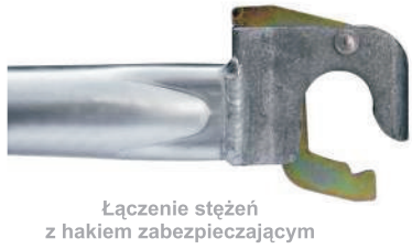
Łączenie stężeń z hakiem zabezpieczającym